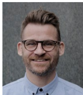
Director de Mind Lab Dinamarca