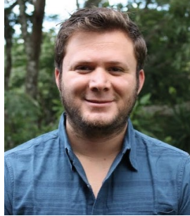
Costa Rica - San José