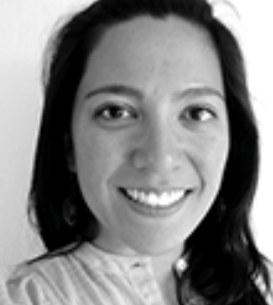
México - Jalisco