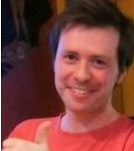
Chile - Santiago de Chile