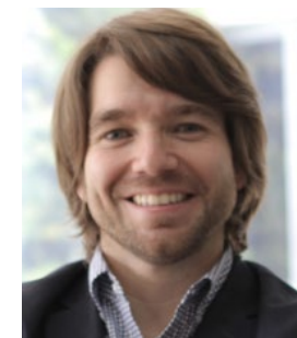
Agencia Nacional para la Superación de la Pobreza Extrema - Colombia