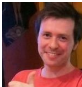
Sub-Director de Proyectos de Innovación del Laboratorio de Gobierno de Chile