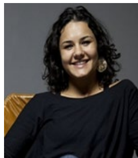
Directora de Gestión, Emprendimiento e Innovación de la Secretaría de Economía Creativa del Ministerio de Cultura de Brasil