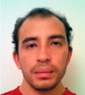
Costa Rica - San José