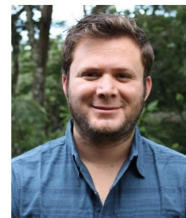
Ministerio de Comercio Exterior Costa Rica - Escazú