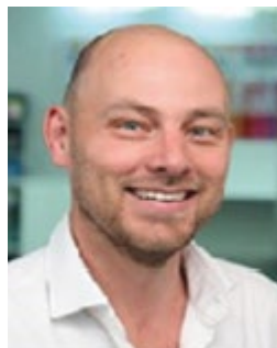
Director de Innovation Skills - NESTA - Inglaterra