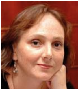
Chile - Santiago de Chile