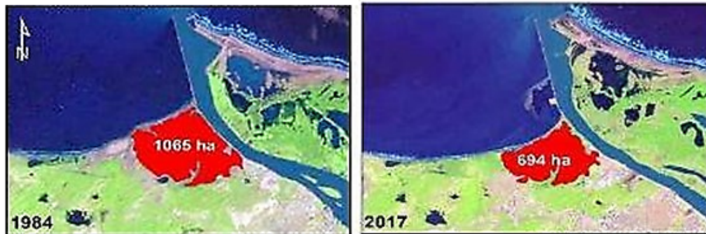
Figura 2 Análisis evolutivo de la Ciénaga de Mallorquín 1984 vs. 2017