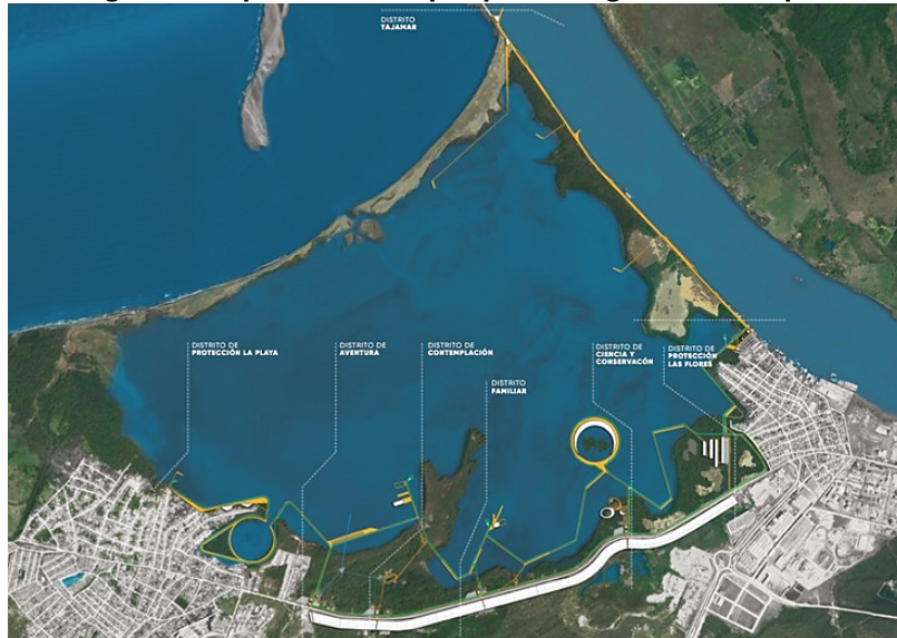
Figura 4 Propuesta de Ecoparque Ciénaga de Mallorcaín