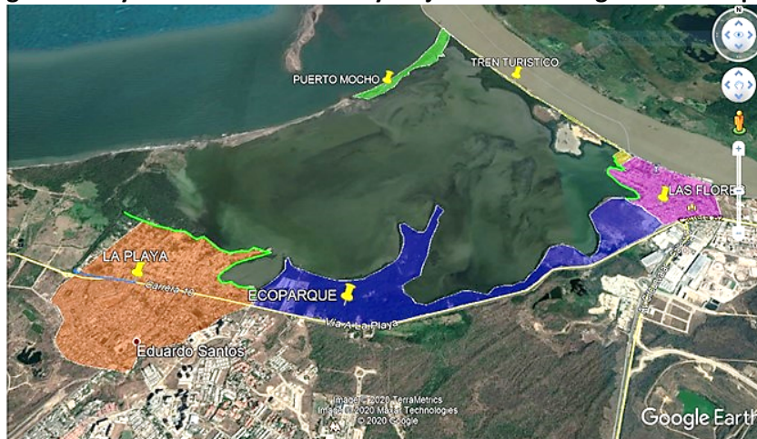
Figura 1 Proyectos de intervención y mejora de la Ciénaga de Mallorca

Tanto la población local, cómo las autoridades municipales son conscientes de la importancia de este ecosistema para el equilibrio ecológico y de allí la necesidad de su conservación. Por esta razón, se ha identificado un potencial para el desarrollo en torno a la ciénaga de proyectos sostenibles orientados a la recreación y el turismo. Con estos proyectos se busca un menor impacto en el sistema biológico y una posibilidad de mayor generación de ingresos para las familias que explotan económicamente el recurso, frente a actividades tradicionales que ejercen mayor presión y que hoy, están seriamente mermadas por el grado de afectación y antropización en que se encuentra la ciénaga de Mallorca. La imagen a continuación presenta las principales áreas de intervención previstas en la ciénaga de Mallorca: