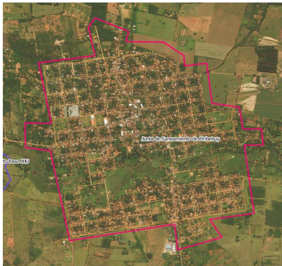
Delimitación tentativa del área de proyecto - Ciudad Piribebuy

Respuesta 13: El área de proyecto se definirá teniendo en cuenta el casco urbano más densamente poblado de cada ciudad, la delimitación tentativa se señala en los mapas que se presentan a continuación. De acuerdo a las necesidades particulares de cada municipio, estas áreas podrán incrementarse hasta un 20%, sin que ello implique costos adicionales para la contratante.