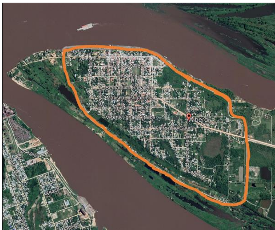
Delimitación tentativa del área de proyecto - Ciudad Alberdi