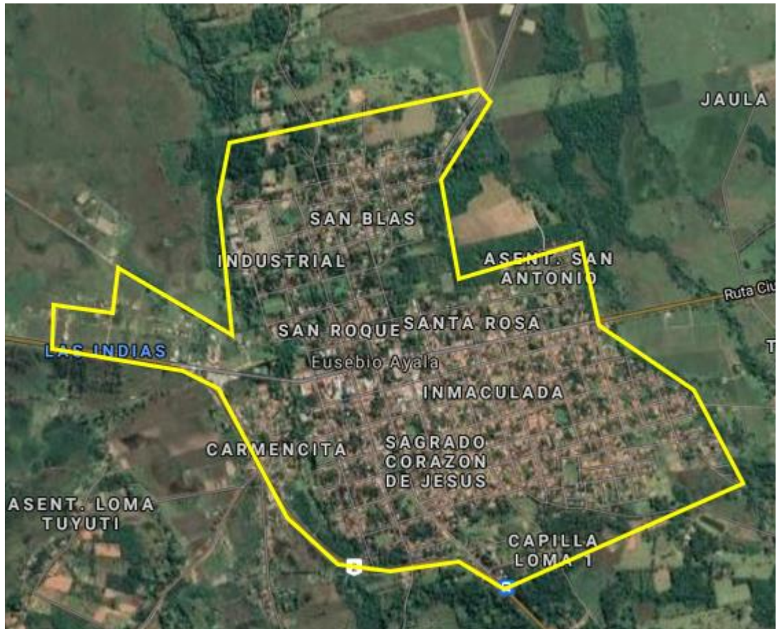
Delimitación tentativa del área de proyecto - Ciudad Eusebio Ayala