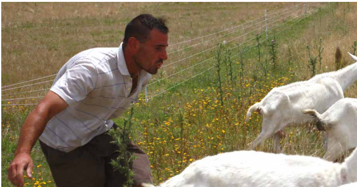
Apoyo a las cadenas de valor, con miras a su consolidación en el mercado interno y la internacionalización de la producción