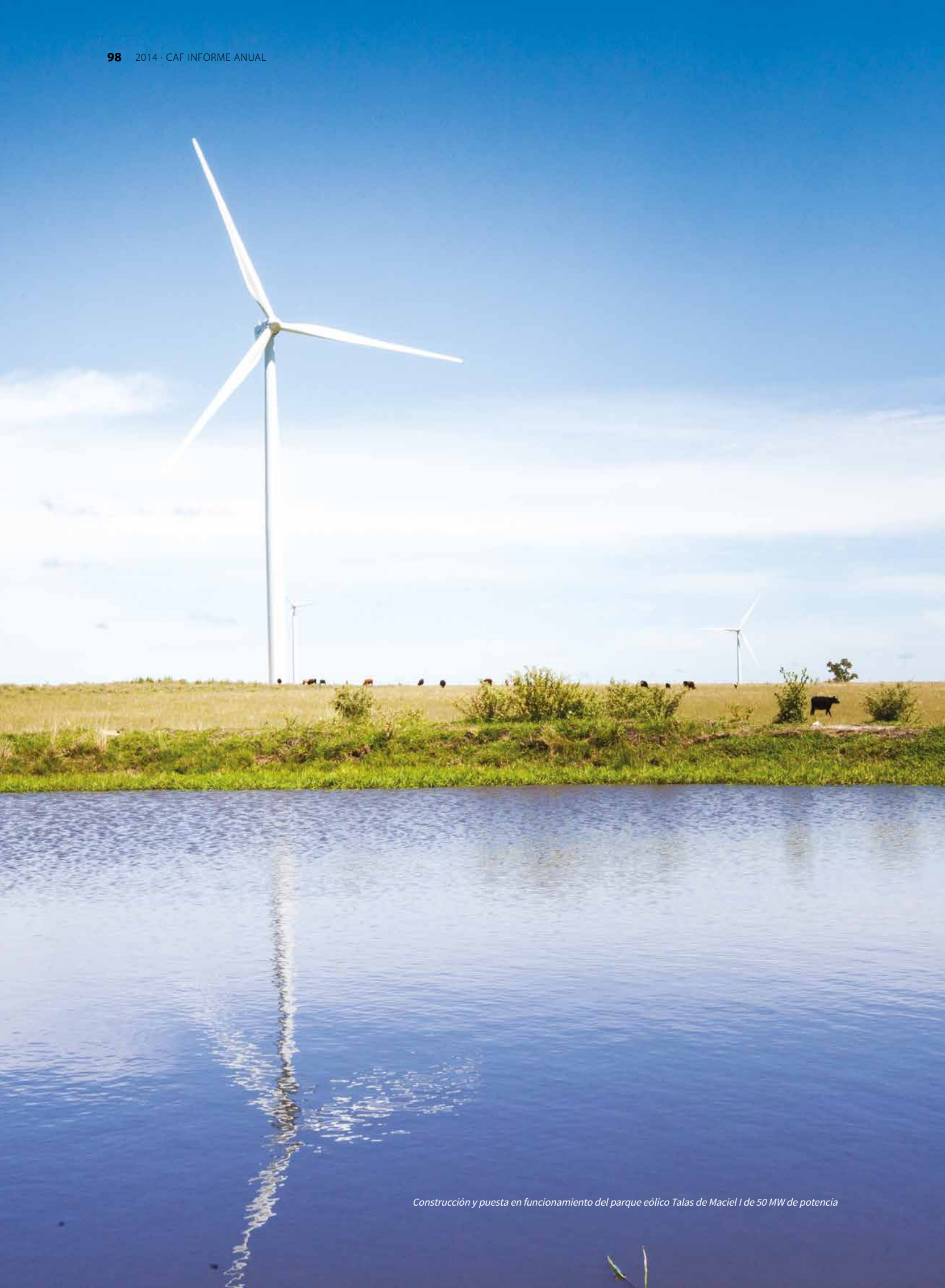
Construcción y puesta en funcionamiento del parque eólico Talas de Maciel I de 50 MW de potencia