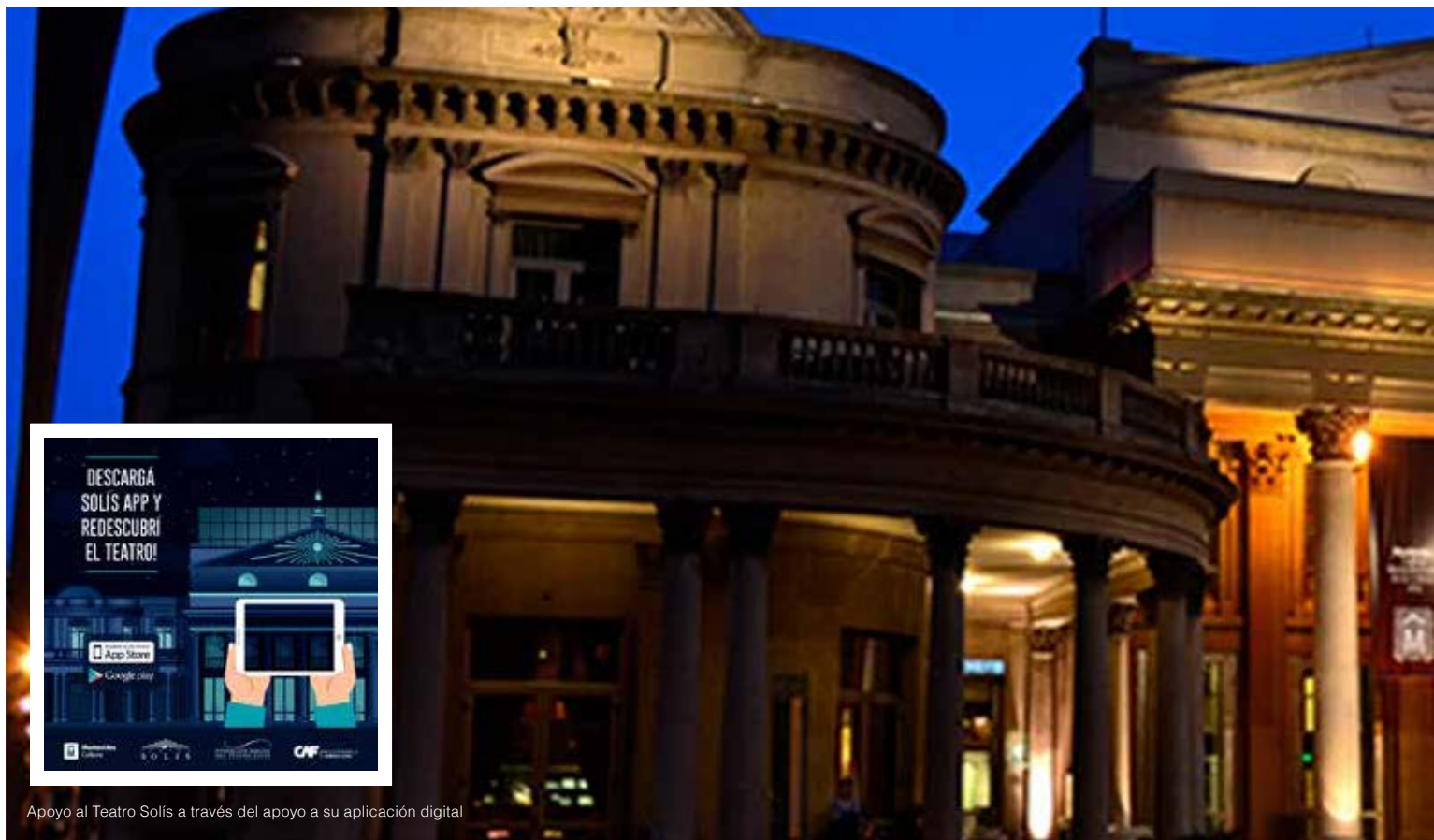
Apoyo al Teatro Solís a través del apoyo a su aplicación digital