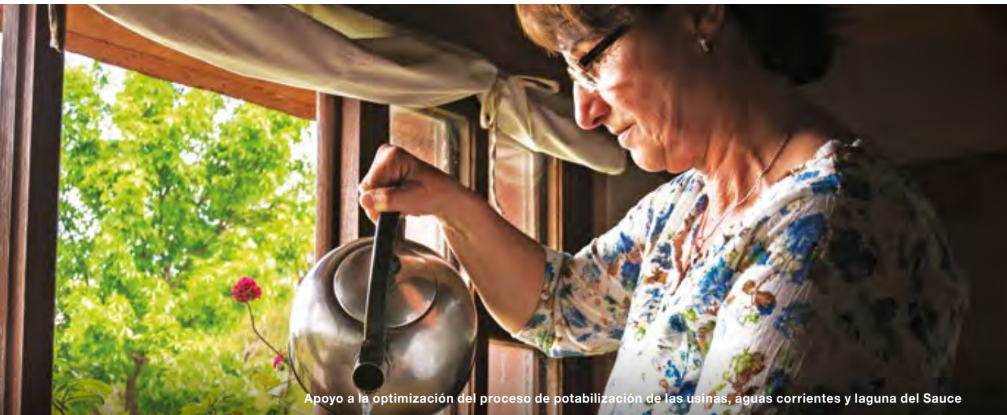
Apoyo a la optimización del proceso de potabilización de las usinas, aguas corrientes y laguna del Sauce