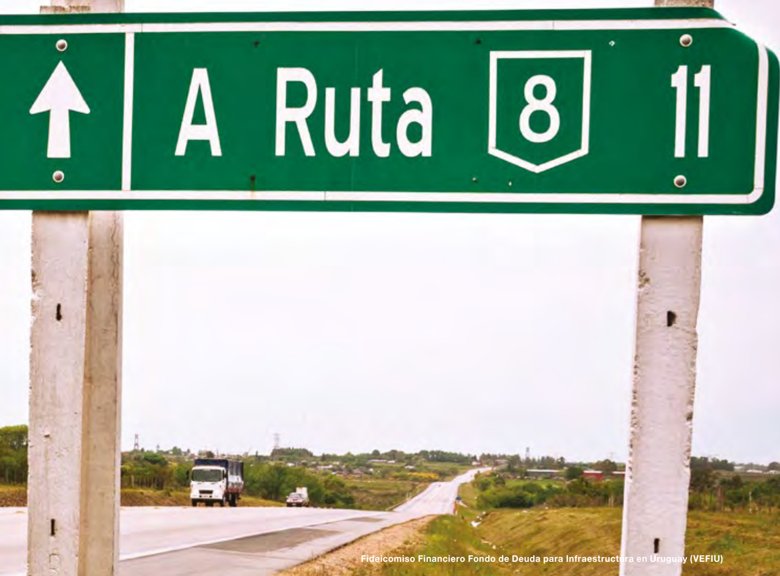
Fideicomiso Financiero Fondo de Deuda para Infraestructura en Uruguay (VEFIU)