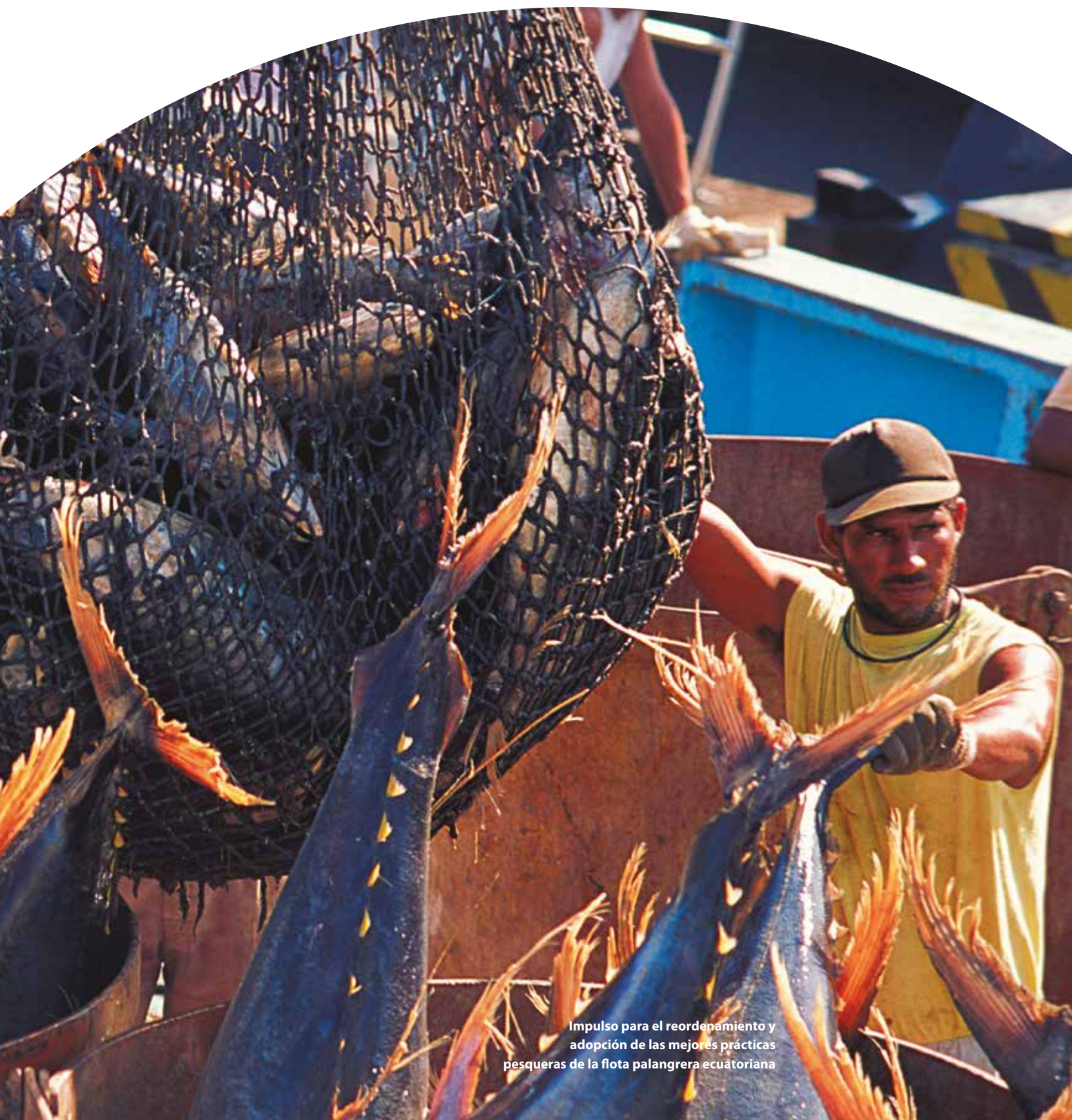
Impulso para el reordenamiento y adopción de las mejores prácticas pesqueras de la flota palangrera ecuatoriana