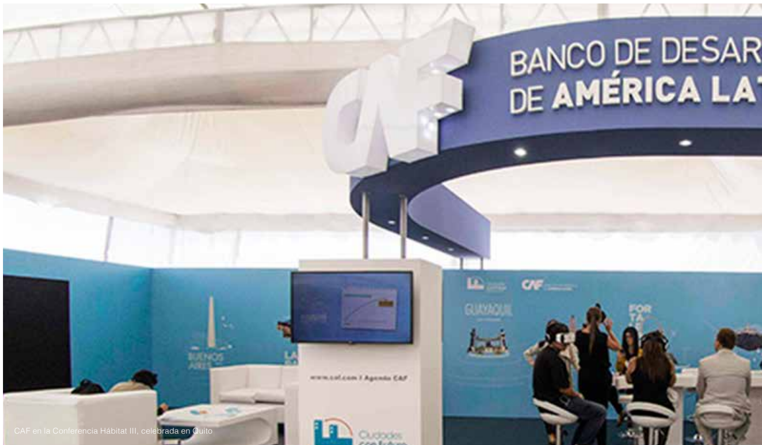
CAF en la Conferencia Hábitat III, celebrada en Quito