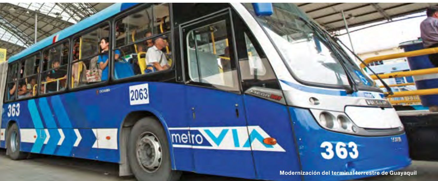
Modernización del terminal terrestre de Guayaquil