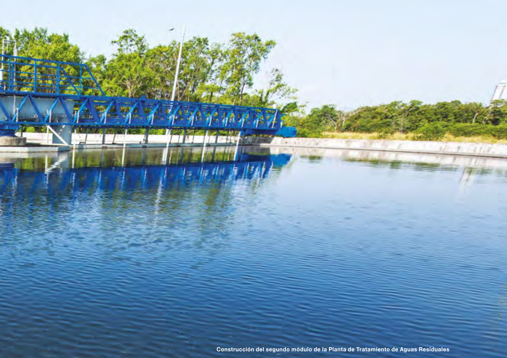
Construcción del segundo módulo de la Planta de Tratamiento de Aguas Residuales