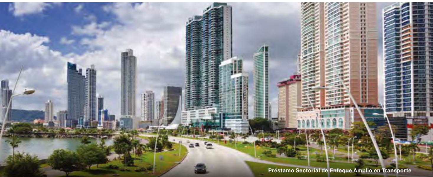
Préstamo Sectorial de Enfoque Amplio en Transporte