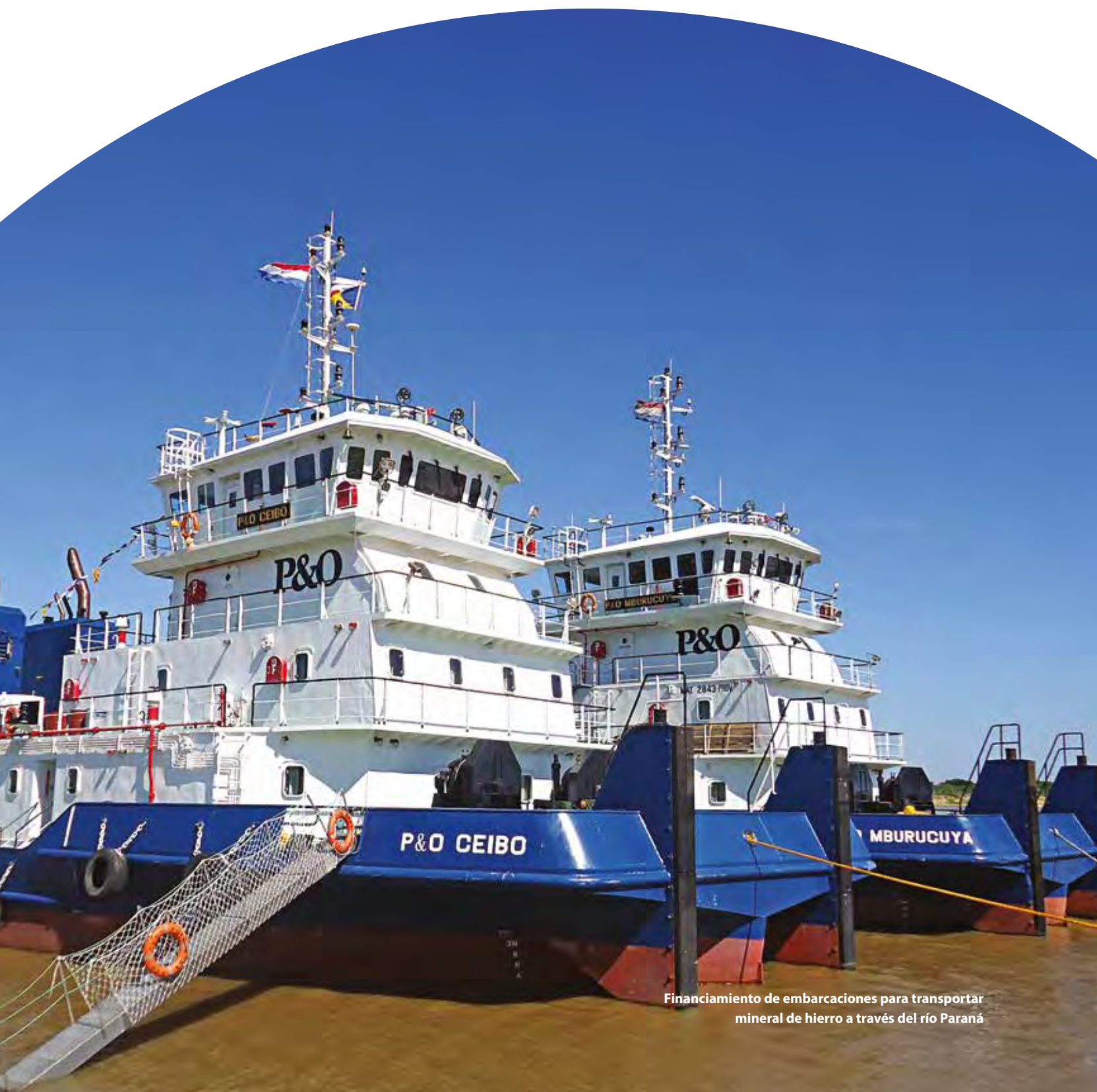
Financiamiento de embarcaciones para transportar mineral de hierro a través del río Paraná