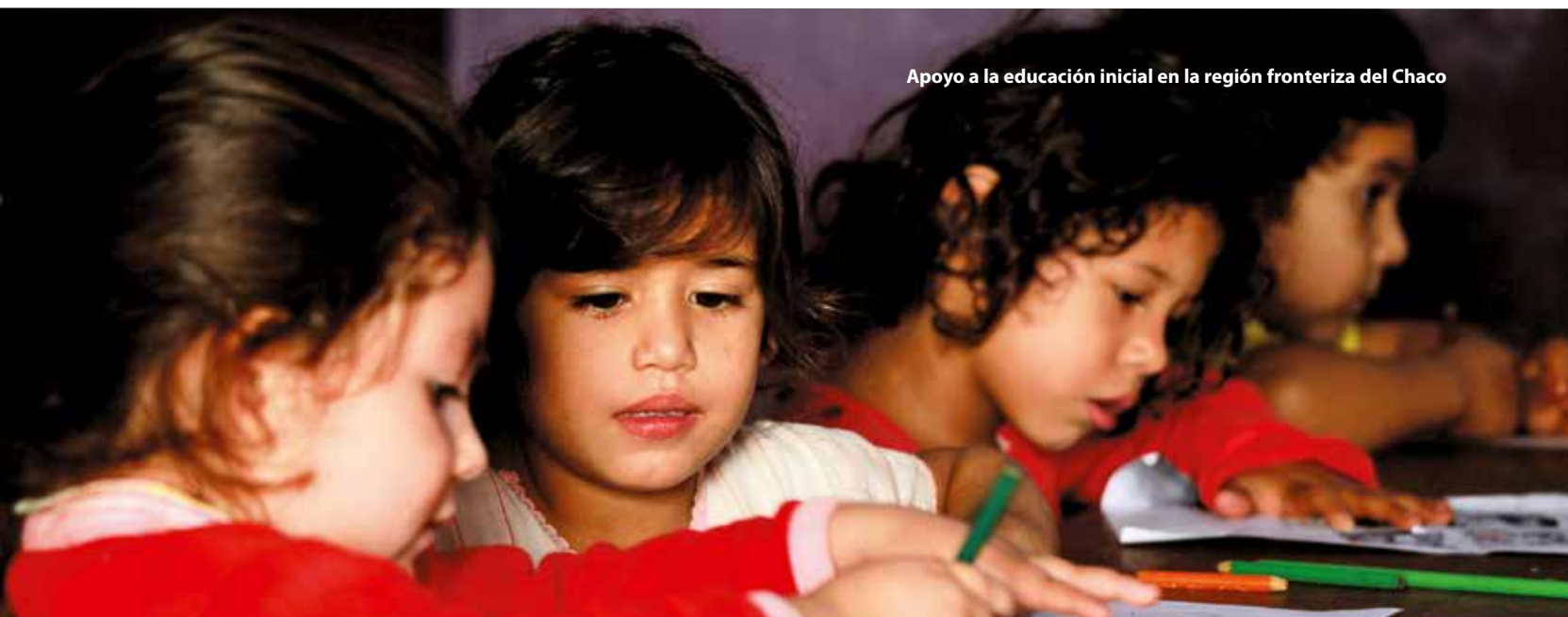
Apoyo a la educación inicial en la región fronteriza del Chaco

MONTO TOTAL: USD 0,6 MILLONES | PLAZO: VARIOS