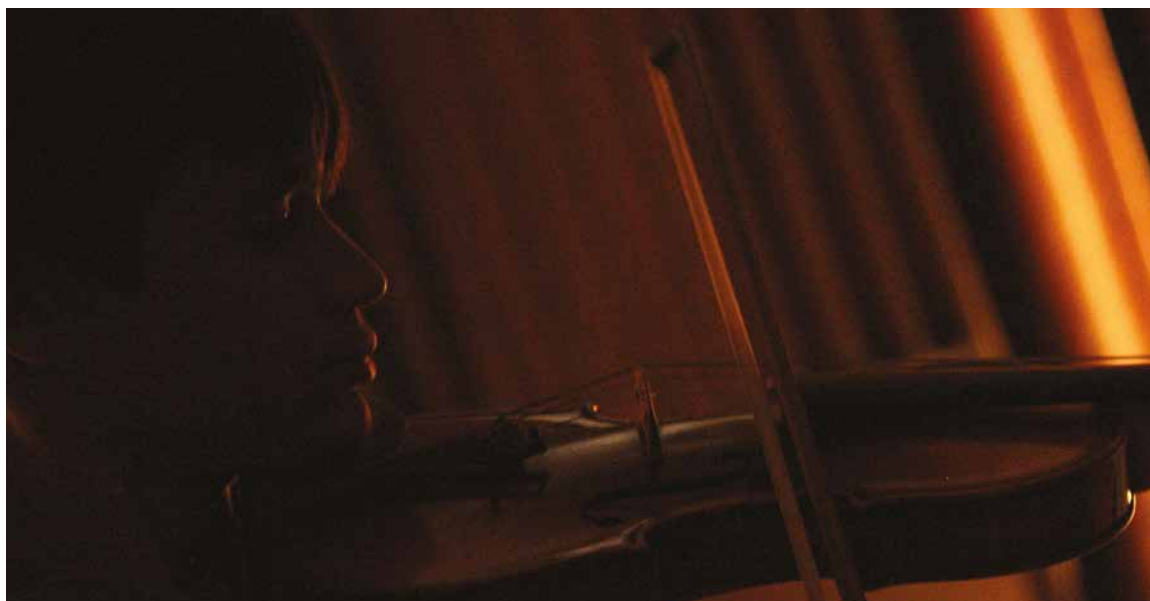
Programa Música para Crecer