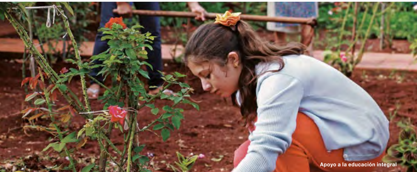
Apoyo a la educación integral