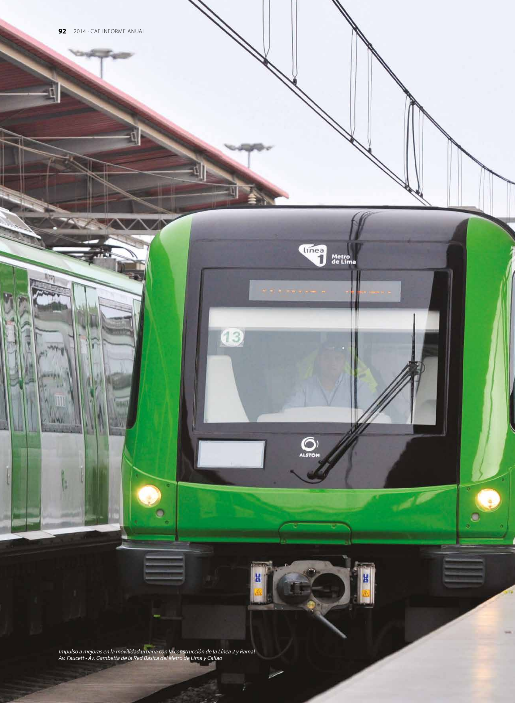
Impulso a mejoras en la movilidad urbana con la construcción de la Línea 2 y Ramal Av. Faucett - Av. Gambetta de la Red Básica del Metro de Lima y Callao