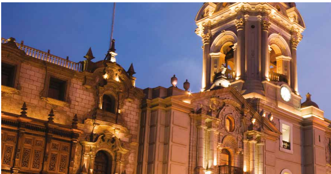
Diagnóstico situacional e institucional y la agenda en seguridad ciudadana para Lima metropolitana