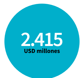
Aprobaciones totales en Perú durante 2014