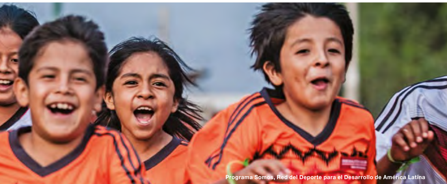
Programa Somos, Red del Deporte para el Desarrollo de América Latina