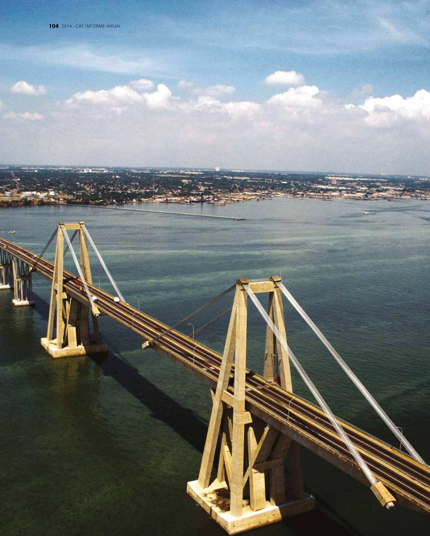
Proyecto de suministro e instalación de un cable sublacustre de 400kV en el lago de Maracaibo para fortalecer el sistema eléctrico