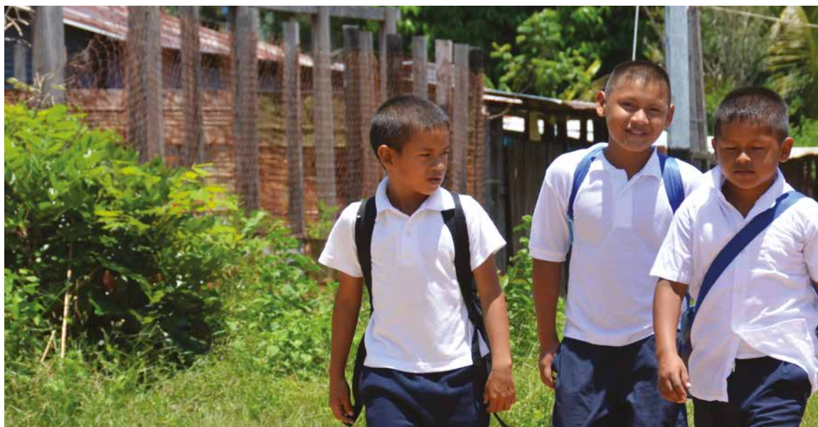
Apoyo a comunidades rurales a través de diversos proyectos, como el de telemedicina en el sur del país