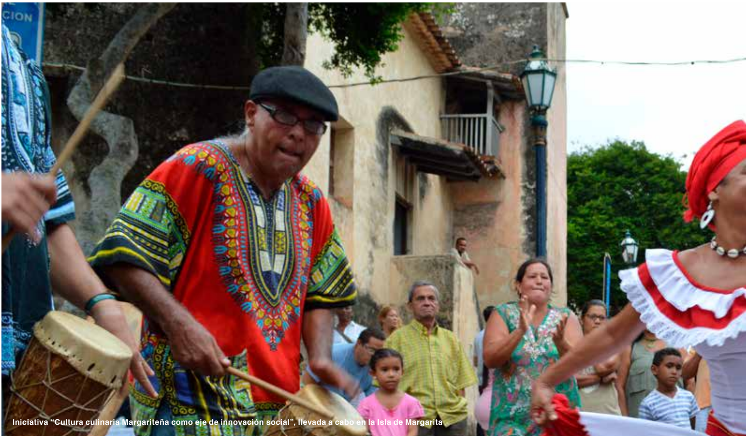
Iniciativa "Cultura culinaria Margariteña como eje de innovación social", llevada a cabo en la Isla de Margarita

modernización de la Central Hidroeléctrica Simón Bolívar (CHSB), el cual cuenta con un financiamiento de CAF por hasta USD 380 millones y busca incrementar en más de 1.500 MW la capacidad de generación del Sistema Eléctrico Nacional.