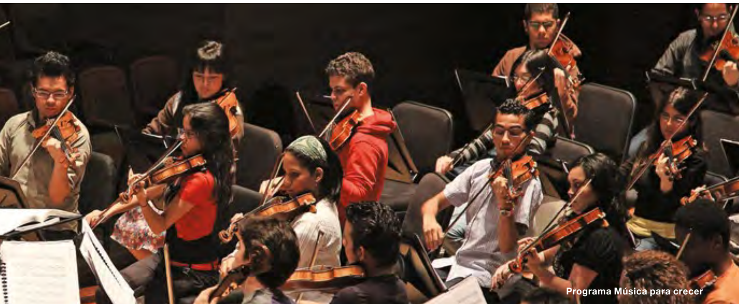
Programa Música para crecer