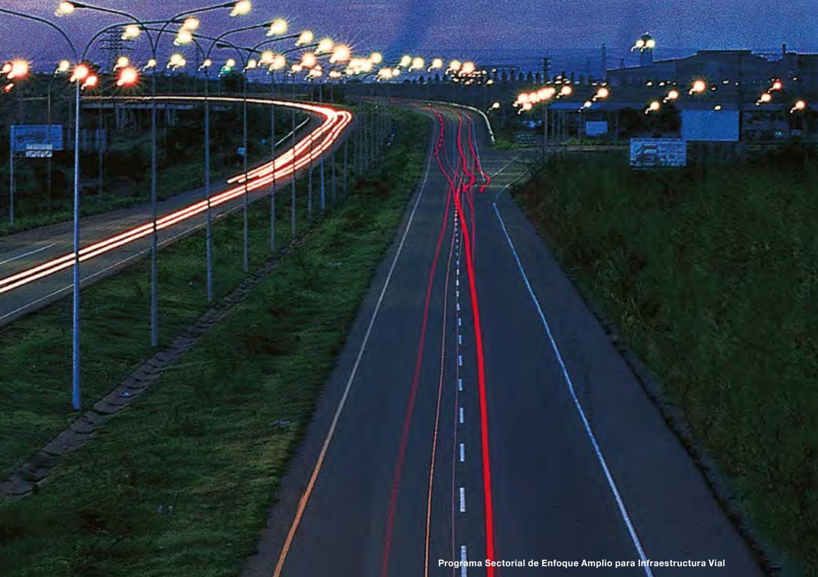
Programa Sectorial de Enfoque Amplio para Infraestructura Vial