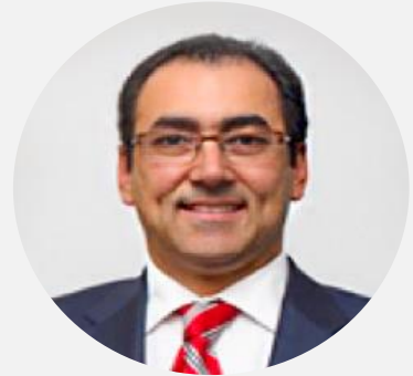
Sergio Díaz-Granados Presidente Ejecutivo, CAF

“Desde CAF entendemos la gobernabilidad y la innovación pública como el ambiente adecuado para la legitimación de las acciones de gobierno, a través de instituciones con procedimientos y reglas claras, capacidad, eficiencia, transparencia y agilidad de respuesta a las demandas de la ciudadanía”