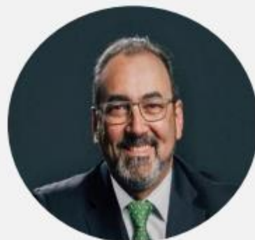
Sergio Díaz-Granados Presidente Ejecutivo, CAF

"No CAF acreditamos que governabilidade e inovação pública são o ambiente adequado para a legitimação das ações governamentais, por meio de instituições com procedimentos e regras claras, capacidade, eficiência, transparência e agilidade na resposta às demandas da cidadania."