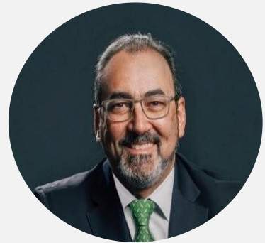
Sergio Díaz-Granados Presidente Ejecutivo, CAF

“Desde CAF buscamos contribuir al fortalecimiento institucional mediante la capacitación de líderes y lideresas de la región, en el desempeño eficaz de sus funciones, desde una perspectiva que procura asegurar un balance apropiado de variables políticas, económicas, sociales, climáticas y de género”.